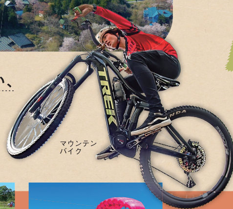
マウンテンバイク