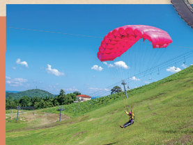
パラグライディング

夏の神鍋山も魅力いっぱい！ 豊岡市観光公式サイト 神鍋グリーンシーズン こちらの二次元コードから▶▶▶